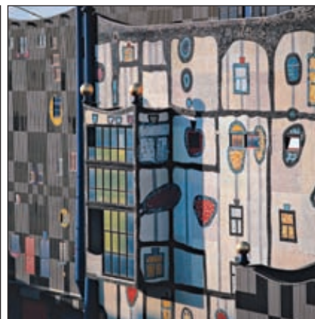
Мусоросжигательный завод Fernwärme Wien — одна из архитектурных достопримечательностей Вены. Теплостанция способна обеспечивать теплом 225 тыс. потребителей

дит распад отходов на пиролизный газ и углеродо-минеральный твердый остаток. Пиролизный газ сжигается в топке котла-утилизатора. Там же сжигается угольная составляющая твердого остатка, который после выхода из пиролизного барабана подвергается сепарированию с отделением металлов, стекла, бетона, керамики. Характерным представителем этой группы является технология SBV (Schwel — Brenn — Verfahren) концерна Siemens KWV.