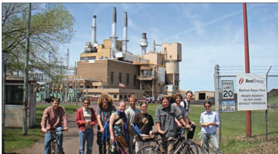
Электростанция Bayfront Power принадлежит компании Xcel Energy. Ее выходная мощность составляет 76 МВт. Раньше электростанция работала только на угле, но затем была переоборудована и сейчас способна перерабатывать также древесные отходы (опилки, щепы, древесная кора, железнодорожные шпалы) и автомобильные покрышки

На второй стадии процесса осуществляется раздельная термическая обработка органической и неорганической субстанций в условиях пиролиза-газификации. При этом горючая масса поступательно перемещается по термоаппарату в одном направлении. Навстречу движению горючей массы перемещается высокотемпературный поток газа.