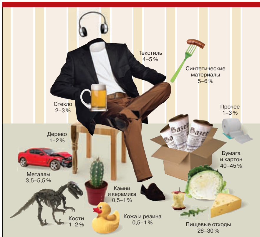
Рис. 2. Морфологический состав российского ТБО

ческая субстанция, фракция вода и до 5 % остаточного минерального балласта, либо органическая субстанция и до 5 % минерального балласта (физическая вода удалена испарением). Зная элементный состав органической составляющей, легко установить ее теоретическую теплотворную способность.