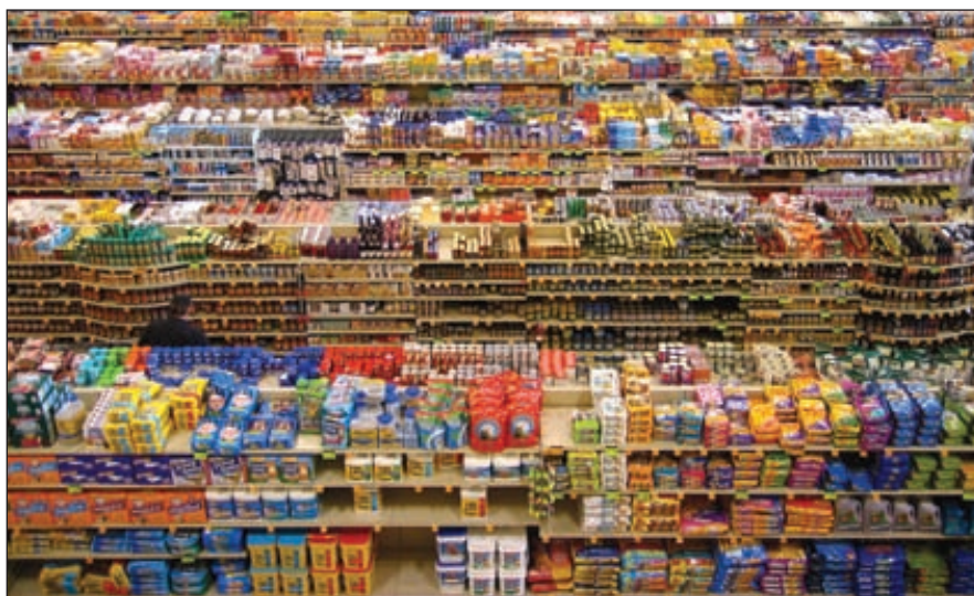
Наполняя потребительский рынок товарами, современная экономика производит колоссальные объемы мусора

Количество ТБО в городах с численностью населения от 30 до 200 тыс. человек достаточно, чтобы обеспечить эксплуатацию цементных заводов мощностью от 15 тыс. т до 130 тыс. т портландцемента в год или кирпичный завод мощностью от 10 до 80 млн штук кирпича в год. ■