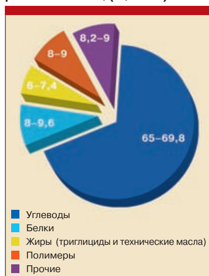
Рис. 1. Состав органической субстанции (горючей массы) российских ТБО, (% масс.)

Разброс составляющих органическую субстанцию элементов для различных полигонов лежит в пределах 4–10 %, разброс химического состава минеральной субстанции ТБО и того меньше (исключение — \text{SiO}_2 ). Если же обратиться к элементному составу органической субстанции, то разброс значений по элементам лежит в узком интервале — 1,5–4,5 %. Поэтому можно считать, что ▶